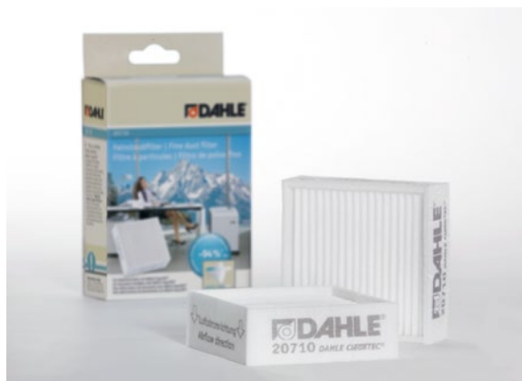
Drobné filtry částek staých Dahle 20710