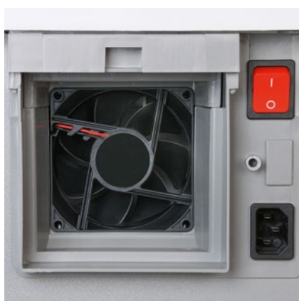
Výkonný ventilátor nasává drobnou částice prachu uvnitř skartovače a odvádí je k filtru