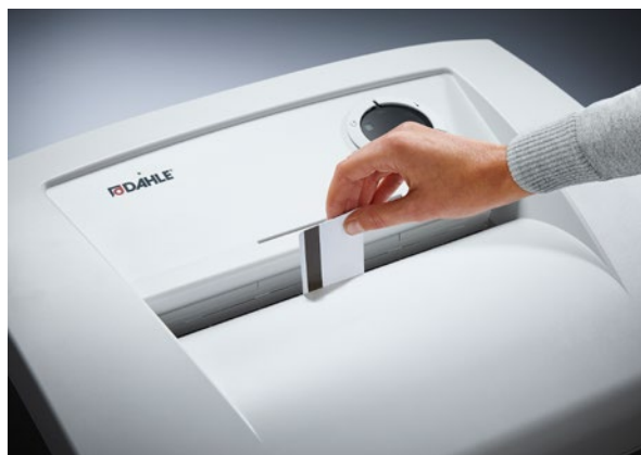
Spolehlivě likviduje karty