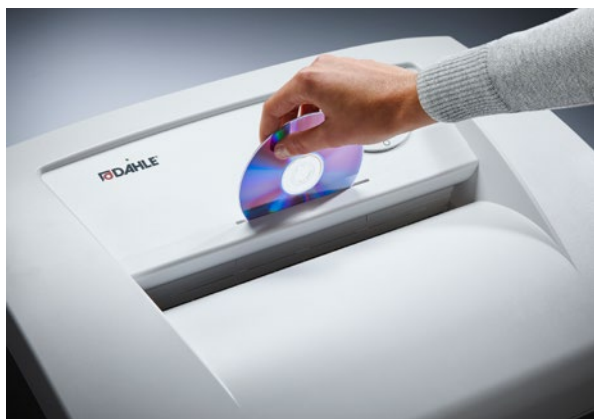
Samostatný slot na CD s vlastním záchytným košem na ekologické třídění odpadů a bezpečnou likvidaci